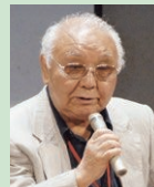
中島 貞夫 Sadao NAKAJIMA