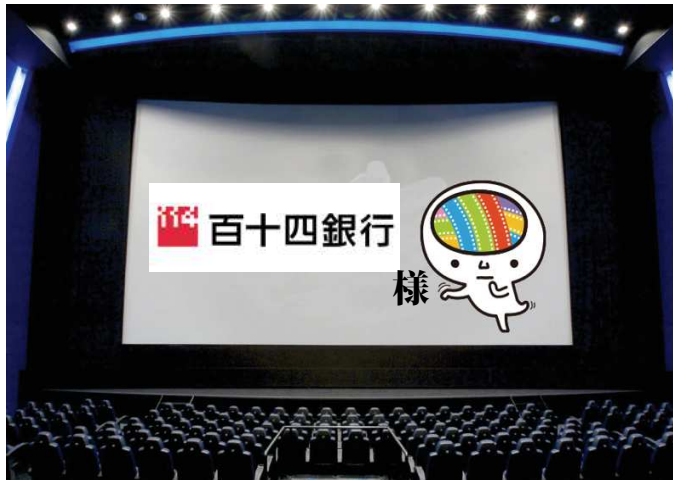
*画像はイメージです。(デザイン等変更になる場合がございます)