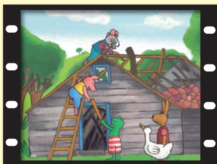
『かえるくととびのねずみ』 オランダ / 7分

7口の声優さんの指導のもと、アニメーションの吹き替えを体験し、その成果をさめき映画祭にて発表します。