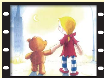
『ランチ』 オーストラリア / 9分