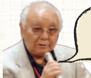
ゲスト講師 映画監督 中島貞夫

大阪芸術大学客員教授、社団法人シナリオ作家協会理事 同志社大学文学部卒業。東映京都撮影所を経て、フリーのシナリオライター。 主に関西を拠点に活動。 代表作【映画】恐竜怪鳥の伝説(1977年)、忍者百地三太夫(1980年) 【テレビドラマ】柳生一族の陰謀、忍者服部半蔵(1999年)、ブロードキャストASUKA(2008年) ほか。 平成23年度～さぬき映画祭「映像塾」シナリオ講座講師。